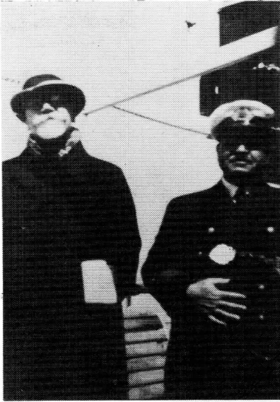
Μέ τον Έλευθέριο Βενιζέλο στή γέφυρα του «Πατρίς».