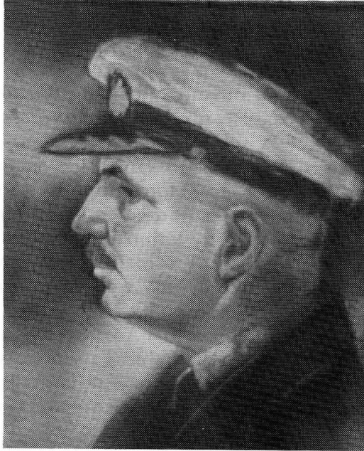
ΓΕΩΡΓΙΟΣ Ι. ΚΟΥΤΣΟΥΚΟΣ (προσωπογραφία Γαλλίδας επιβάτιδας, κόρης του βασιλιά της σάμπάνιας της εποχής εκείνης).