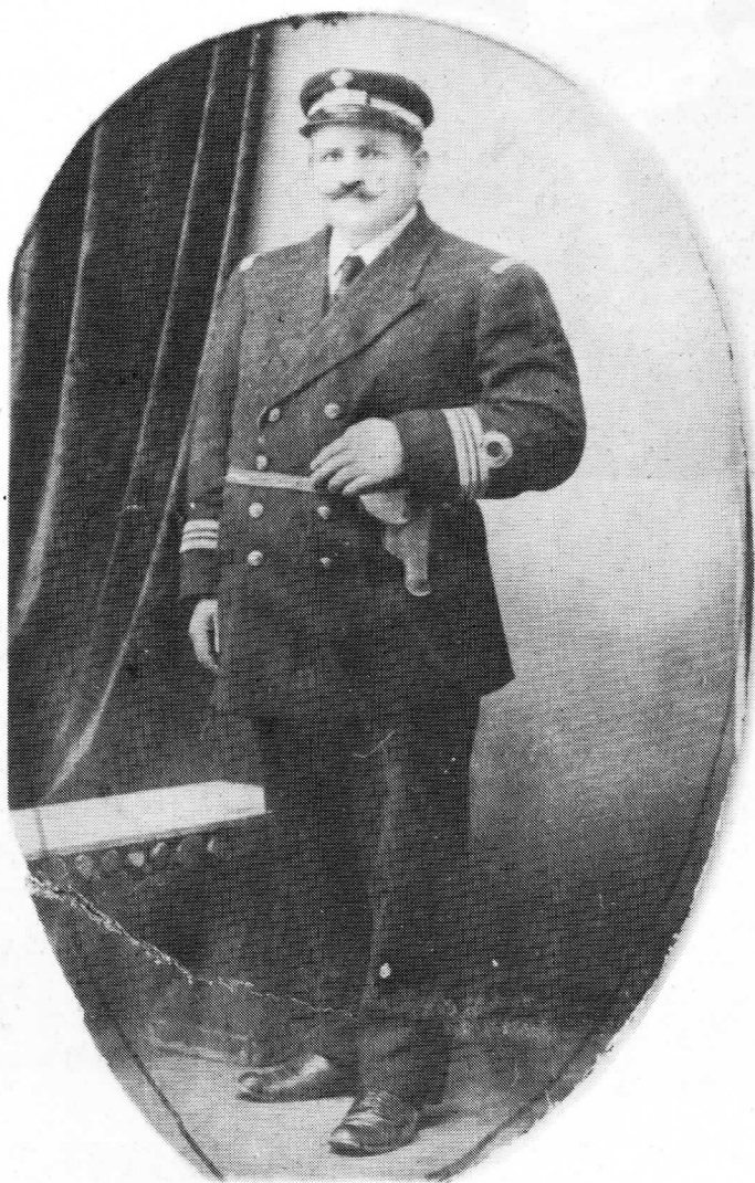
Έπίκουρος Υποπλοίαρχος στους Βαλκανικούς πολέμους.